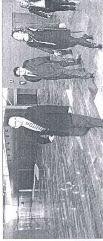
■ El alcalde de Almería, junto con varios concejales durante una visita al centro.